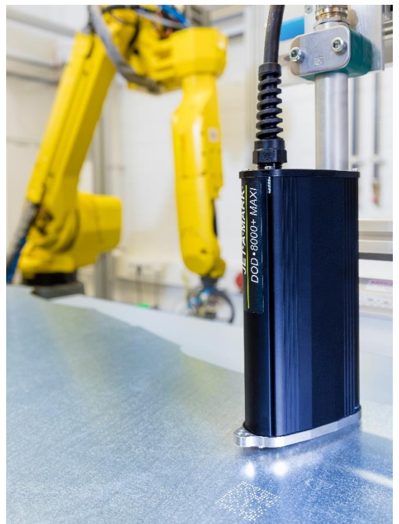
All in one System für automatisierte Bauteilcodierung